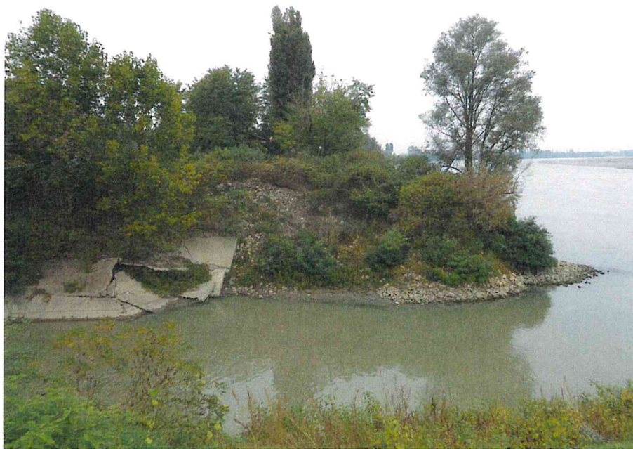
Foto 5: Vista della zona in dissesto in prossimità dello sbocco in Po del torrente Ongina