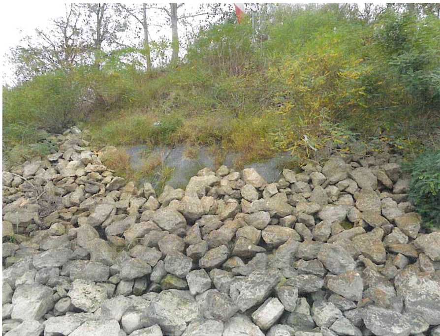
Foto 6: Vista della zona in dissesto in prossimità dello sbocco in Po del Cavo Fontana