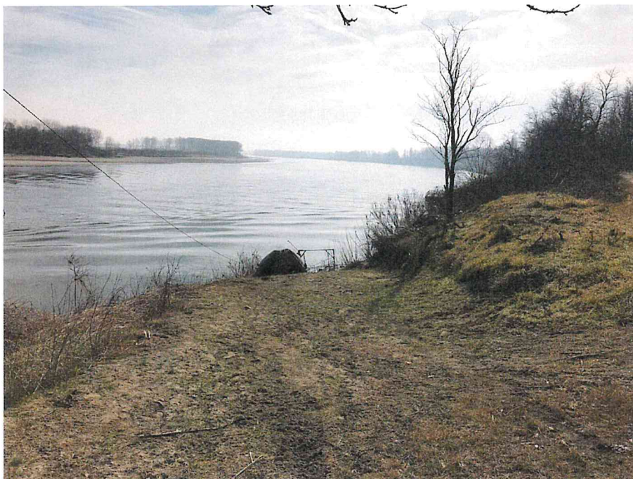
Foto 2: Accesso all'area d'intervento da rampa lungo la curva n. 40